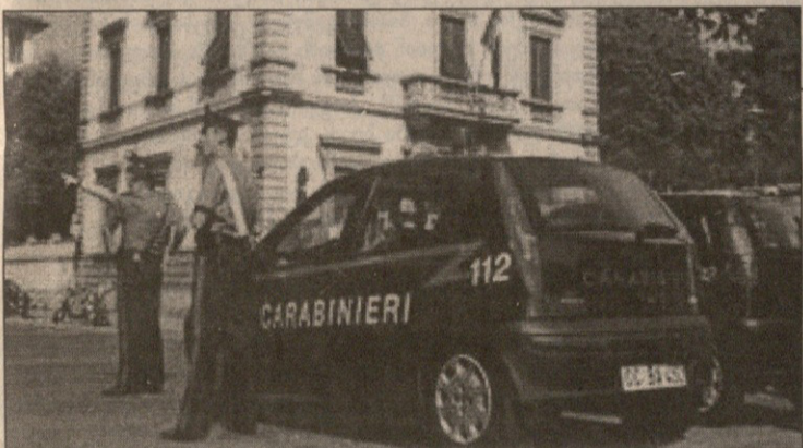
ჩეკი გორის ვილას პოლიციამ ალუა შემოარტყა