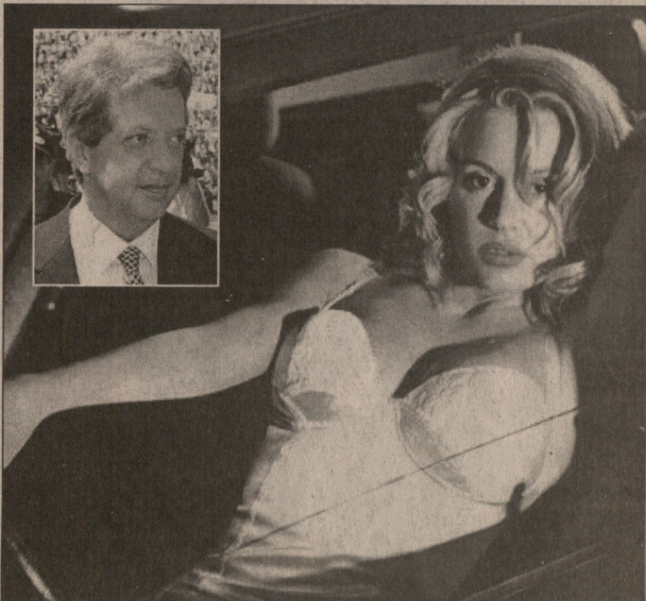
აი, ვის ატყვევდა ვიტორიო ჩეკი გორი ფეხბურთში არმილ ნაშოვან ფულს