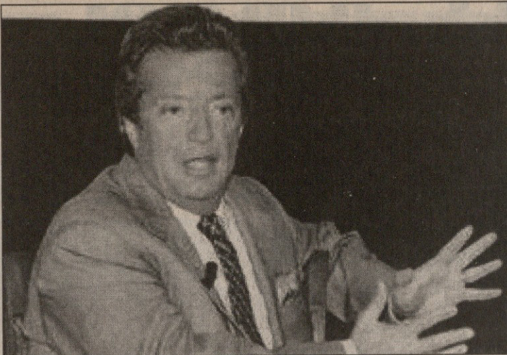
ჩეკი გორი მოსამართლეებს ხელებს ვერ გაუშლს