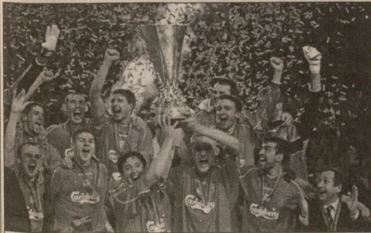
ლიგურული მართლაც საუკეთესო

შპს-სტრუქტურის ისტორიისა და სტატისტიკის საერთაშორისო ფედერაცია ყოველწლიურად ასახელებს საუკეთესოთა ნუსხის საკუთარ ვერსიას. წლებულს სტატისტიკოსთა რჩეული გახდნენ: წლის საუკეთესო კლუბი — უეფას თასის მფლობელი ინგლისის „ლივერპული“. საუკეთესო მწვერთელი — არგენტინელი — „ბოკა ხუნიორის“ დამრიგებელი კარლოს ბიანი, რომელმაც „სახალხო გუნდად“ წოდებულ კლუბს ზედზედ ორჯერ ლიბერთადორესის თასი და შარშან საკონტინენტთაშორისო თასიც მოაგებინა. ნაკრების მწვერთელთაგან საუკეთესოდ აღიარეს საფრანგეთის ეროვნული გუნდის თავაკაცი როჟე ლემერი. საუკეთესო მსაჯი — იტალიელი პიერლუიჯი კოლინა. საუკეთესო საფეხბურთო ლიგად ესპანეთის პრიმერადივიზიონი აღიარეს. უმძლავრეს ლიგათა საუკეთესო ბომბარდირებად დასახელდნენ — ხარედ ბორგეტი (სანტოს ლუგანა, მექსიკა) — 39 გოლი და შვედი ჰენრიკ ლარსონი (გლახგო რეინჯერსი) — 35 გოლი. საუკეთესო მეკარეთა ზეთელი: ფაბიენ ბარტევი (მანჩესტერ იუნაიტედი) — 195 ქულა, ოლივერ კანი (ბაიერნი) — 133 ქულა, ფრანჩესკო ტოლო (ფიორენტინა) — 131, ხოსე ლუის ჩილავერტი (სტრასბური) და იკერ კასილიასი (რეალი).