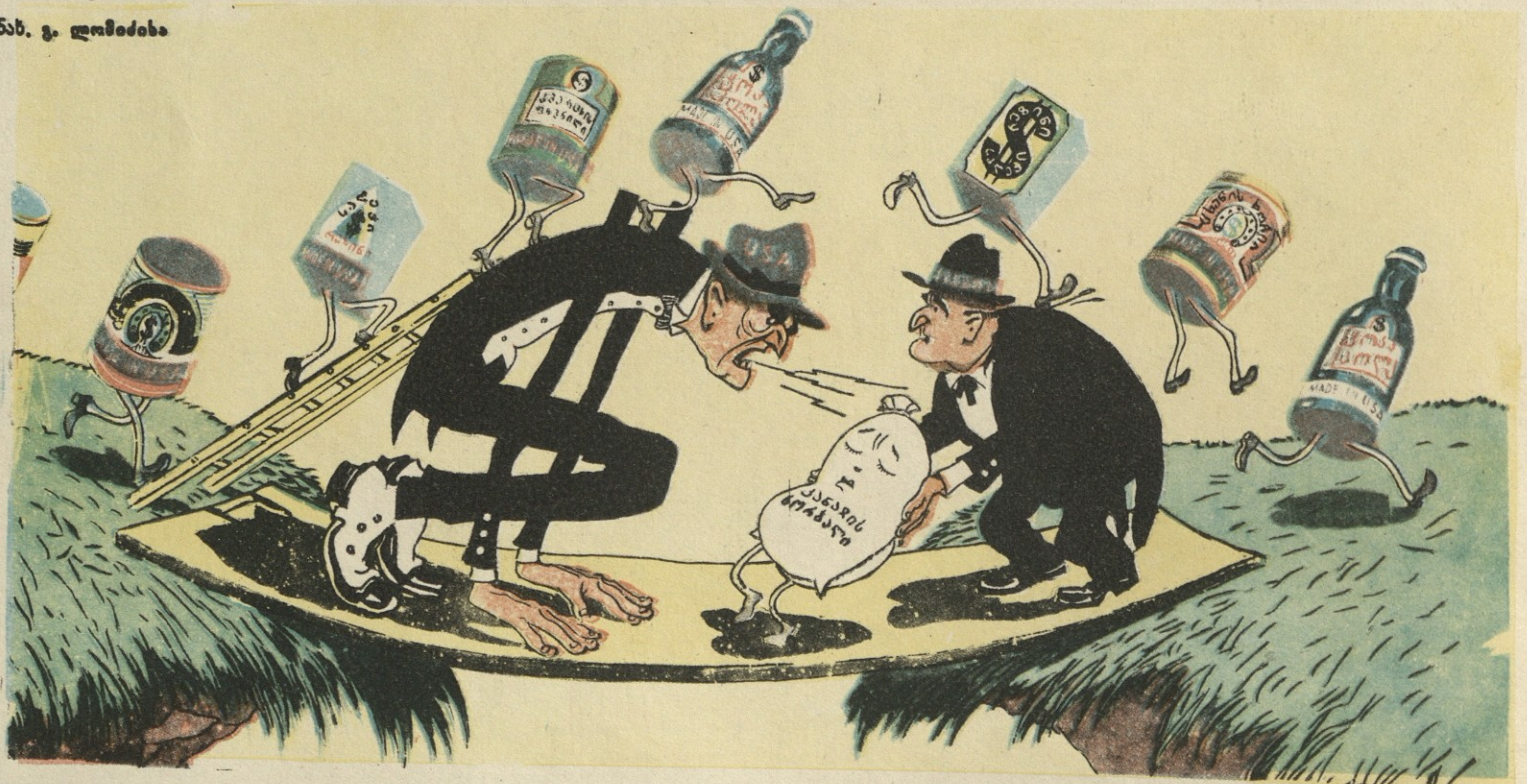
ნახ. გ. ლომიძისა