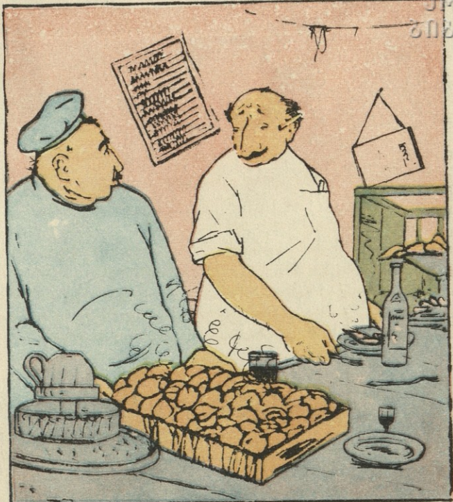
— მომხმარებლის მოთხოვნლება წელს თუ მარტო ასე ვადიდდა, ჩვენ რაღა მოვიხმაროთ?!

ხოფერიამ ხელში ბრძანება დაიჭირა და შეუდგა სიარულს დაწესებულებიდან დაწესებულებაში. ყველგან ამტკიცებდა თავის სიმართლეს, მაგრამ ყველა იმას ერიდებოდა, რომ გ. პირველი დიქტატორული ტონით აცხადებდა: